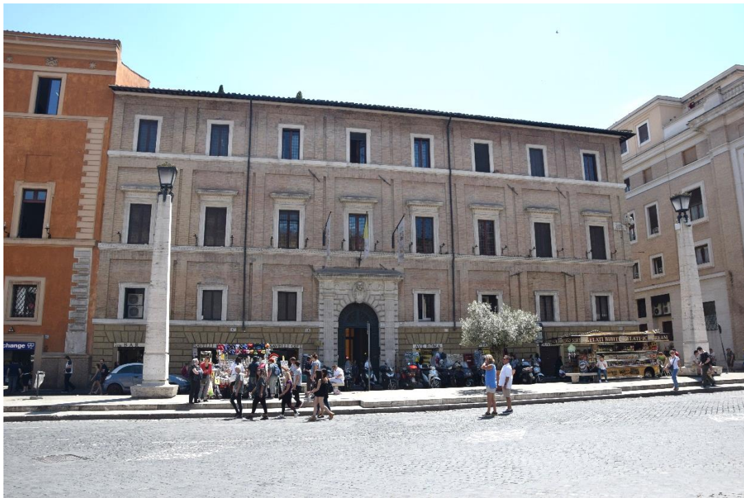
Veranstaltungsort / Sede della manifestazione Palazzo Cardinal Cesi